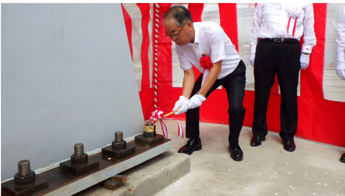
【谷村社長による槌たたきの儀】