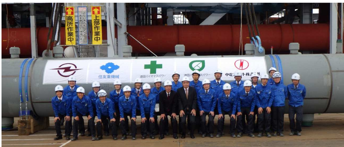
【海田バイオマスパワー役職員】