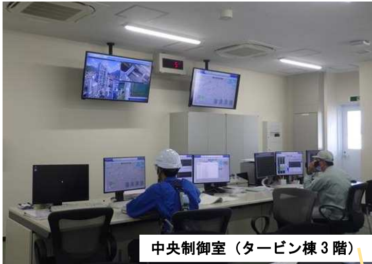
中央制御室（タービン棟3階）

2018年12月から海田発電所の建設工事に着手し、本年9月末には設備の据付、設備単体の試運転を終え、今後は総合試運転を行っていきます。